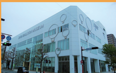
バルーンミュージアム